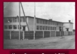
Новы будынак Лукскай СШ. 1975 год