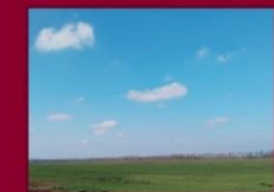
22 красавіка 1969 г. у в. Лука Кобрынскага раёна быў створаны саўгас «Дружба» на базе асушаных зямель масіва «Польскае балота».