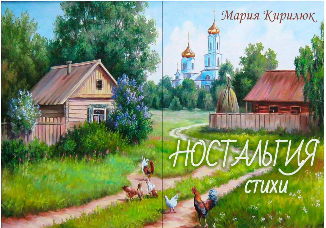
Зборнік вершаў Марыі Кірылюк «Ностальгія»