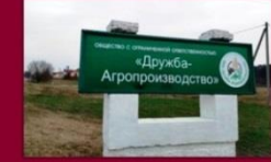
На пасадку дырэктара быў прызначаны Мікалай Кірылавіч Грыневіч. Наступныя 10 гадоў былі аддадзены кіраўніцтву племсаўгасам «Дружба». Менавіта ў тыя гады была закладзена аснова сённяшняму дабрабыту саўгаса.