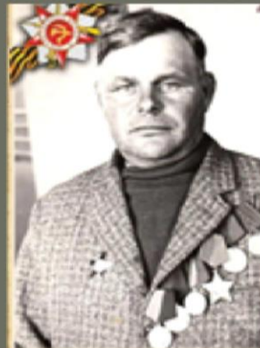
Кірыеўскі Павел Іванавіч